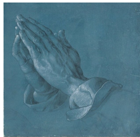
Dürer: Imádkozó kéz

Imádkozni jó! Jó elmondani a Megváltónak mindazt, ami éppen bennünk van, kiönteni a szívünket, Én Istenem Jó Istenem becsukódik már a szemem, de a tied nyitva Atyám amíg alszom vigyáz reám. Azt hiszem ez volt az első imádság, amit elmondtam. 5 éves lehettem amikor édesanyám nagy szeretettel tanítgatott rá. Jó volt tudni, mondani, hogy amíg alszom valaki vigyáz rám. Ugyancsak ilyen betanult, az Úrtól tanult imádság volt a Mi atyánk. Tizenéves koromban Istent keresve alkalmanként többször is elmondtam, egyre nagyobb átéléssel. Mert, hogy nekem sem otthon, sem az akkori konfirmációs képzésen senki nem mondta, hogy imádkozni a saját szavainkkal is lehet. Már felnőtt voltam amikor erről tudomást szereztem. Egyedül csendben, vagy hangosan imádkozzunk? Ha csendben teszem, valahogy könnyebben elkalandoznak a gondolataim. Ha hangosan akkor mindig összeszedettebb a mondanivalóm. Persze sokat segít, ha vannak előre átgondolt imatémáink. Pár éve kialakítottam egy imaforma sorrendet, amit mindig megtöltök aktuális tartalommal, Hálaadás, dicsőítés, bocsánatkérés, saját állapot mesélés, útmutatás kérés, imádkozás másokért. Általában ez a sorrend.