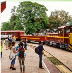
Vonatozás Gyöngyösről Mátrafüredre

GYÜLEKEZETI NAP —családok, gyülekezeti tagok részére a templomkertben július 19-én szombaton