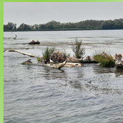
Kirándulás a Tiszatóhoz, ÖKO centrum látogatás