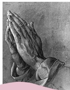
Dürer: Imádkozó kéz